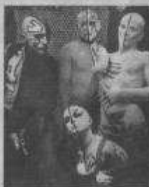
Punish Yourself, en clôture de la soirée metal de vendredi.